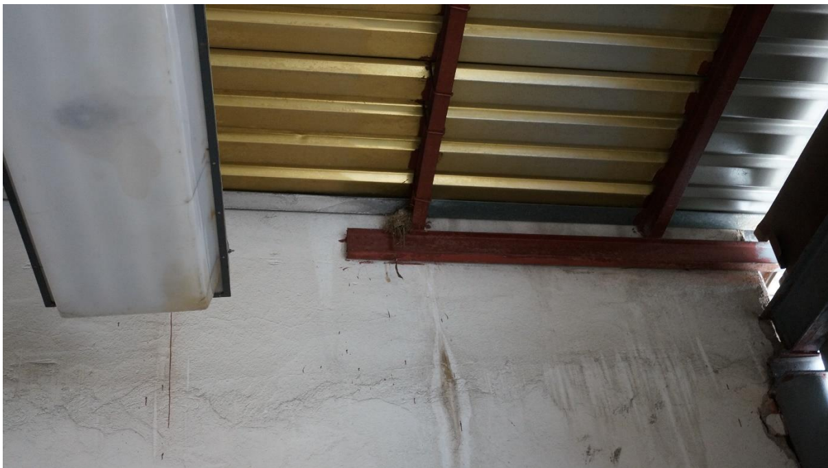
Obr. 5: hnízdo vrabce domácího na ocelové střešní konstrukci