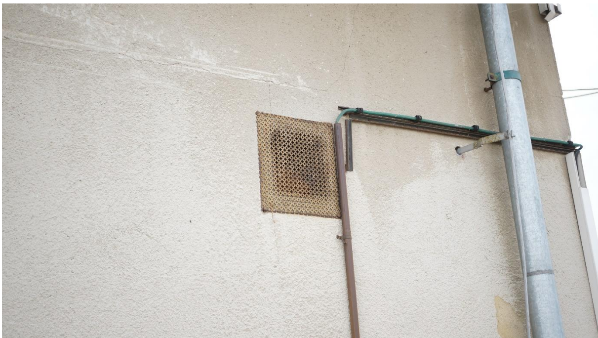
Obr. 2: odvětrávací otvory obvodové konstrukce jsou osazeny mřížkami