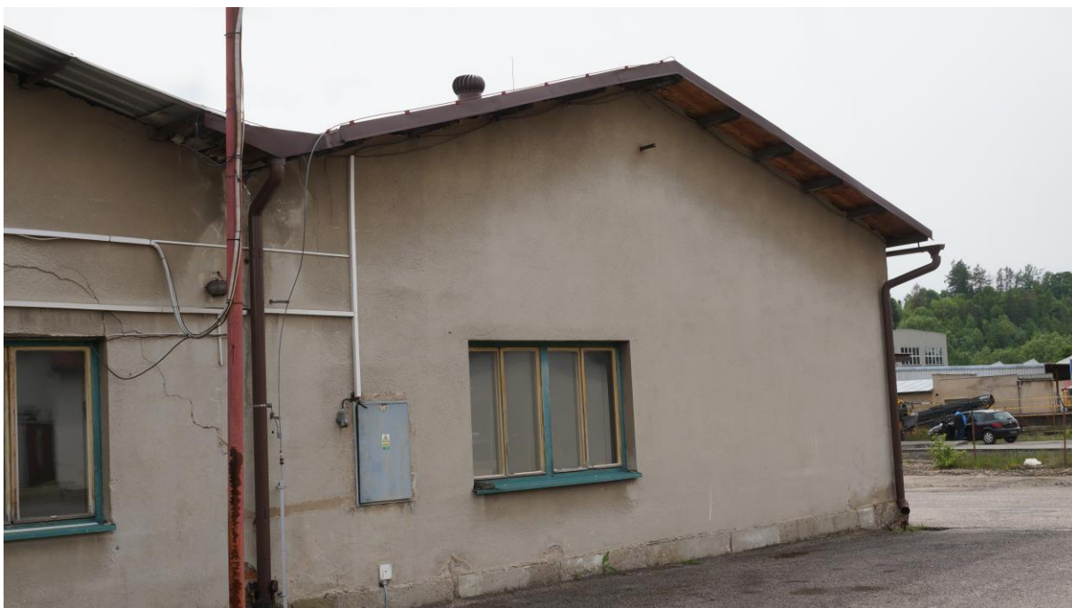
Obr. 6: členitá vnější konstrukce nabízí mnoho úkrytů pod parapety, přesahující střechou nebo za okapy