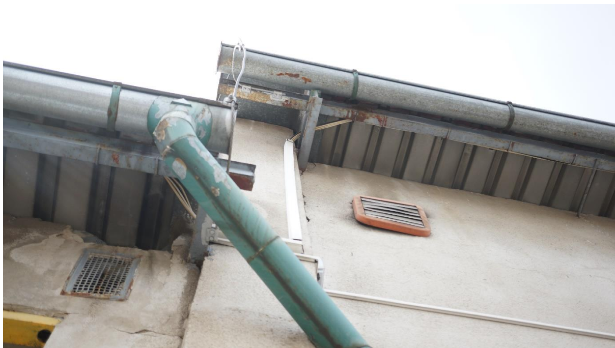
Obr. 3: lety poškozená vnější konstrukce nabízí mnoho štěrbin a dutin pro ptáky a další živočichy