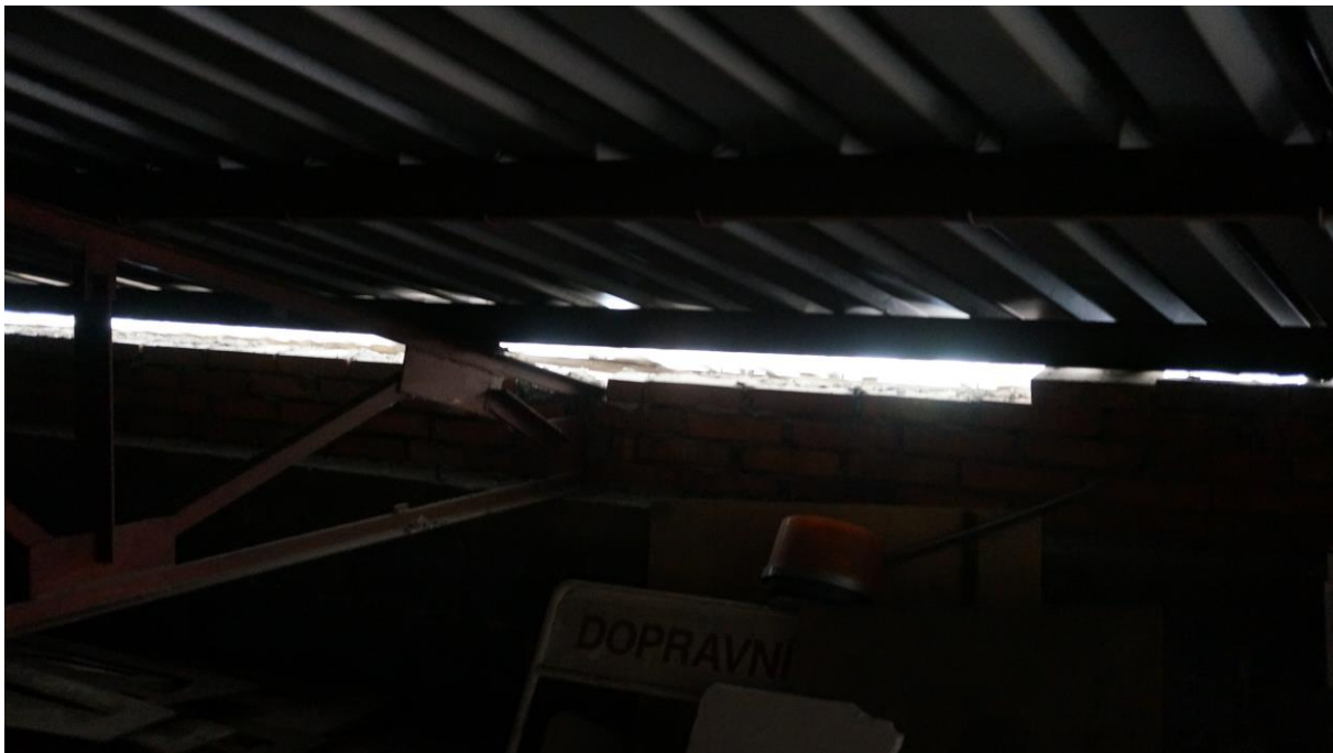
Obr. 1: podstřešní prostory jsou volně dostupné pro živočichy díky množství spár a štěrbin