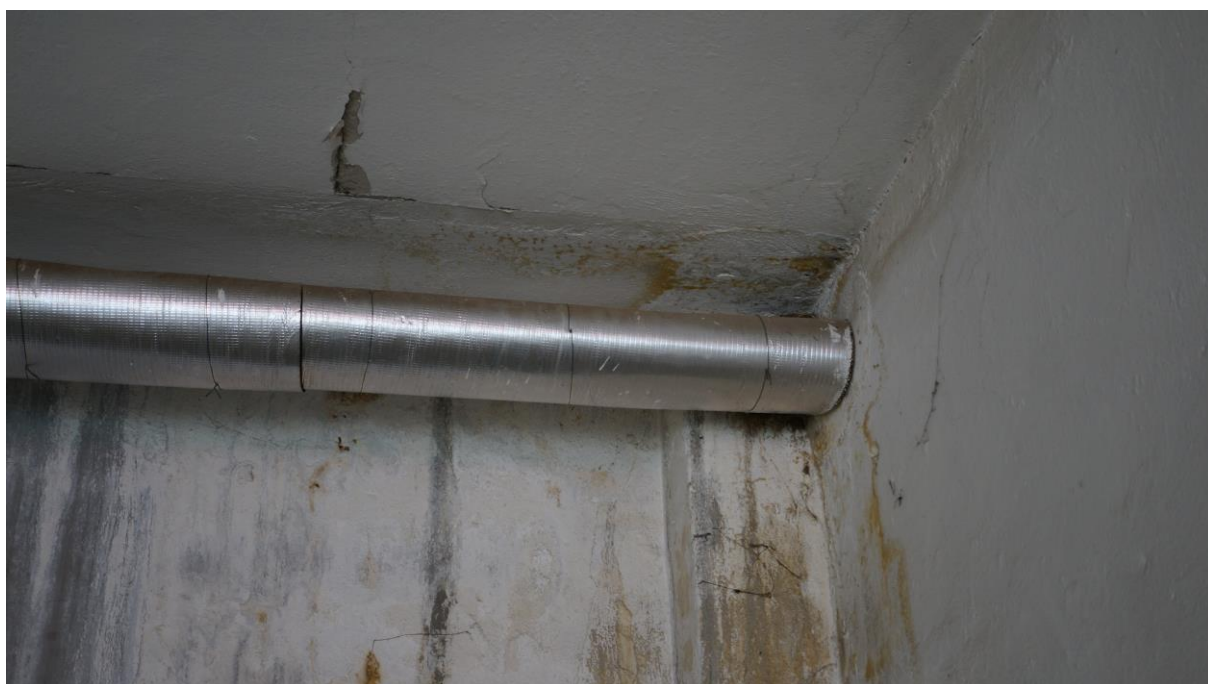
Obr. 4: hnízdo vrabce domácího na zaizolovaném potrubí